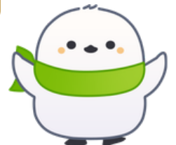
公式キャラクター コウコトリ