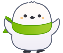
公式キャラクター コウコトリ