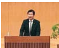
長浜市長来賓あいさつ