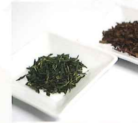
NAGA.MAR-18 (株)ふるさと夢公社のもの

滋賀県長浜市木之本町木之本 990 0749-82-3037 https://www.hokkokukaidou.com