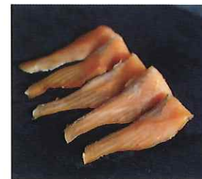
NAGA.MAR-05 株式会社ヤブゲン

📍 滋賀県長浜市相模庭町 861-2 ☎ 0749-74-0327 🌐 https://sofara-tei.com