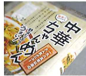
NAGA.MAR-01 パーティーハウス

TEL.0749-78-2121/FAX.0749-78-1300 / https://nagahamasci.or.jp ※詳しくは各道の駅まで