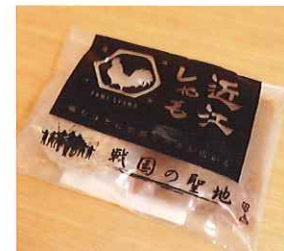
NAGA.MAR-07 (株)浅井三姉妹の郷

📍 滋賀県長浜市三川町 1247 ☎ 0749-73-4000 🌐 http://yabugen.jp