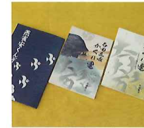
NAGA.MAR-04 姫の風ステーション

📍 滋賀県長浜市三田町 351 ☎ 0749-74-3236 🌐 https://hyakusyoyouya.com