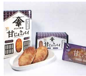
NAGA.MAR-20 菓子乃蔵 角屋

滋賀県長浜市木之本町木之本 1105 0749-82-3162 https://www.tsuruyapan.jp