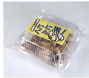
NAGA.MAR-15 dream drop

手作り熟成黒にんにくは、アミノ酸が多く含まれており、スタミナ強化や疲労回復に最適です。黒にんにくで夏を乗り切りましょう。