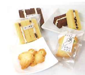
NAGA.MAR-21 ファンタジア大和

滋賀県長浜市木之本町木之本 1072 0749-82-2031 https://kadoya1930.com